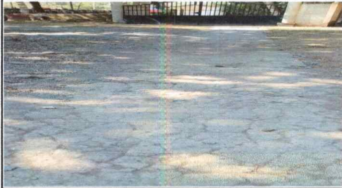
Foto 1: Acera de 1 metro de ancho dañado que lleva de la entrada del portón hacia las instalaciones de los corredores de la aulas